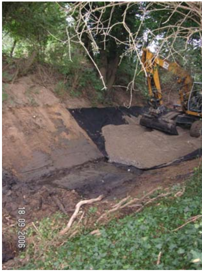
Gutachten zur Erhaltung der Bachbegleitenden Baumvegetation bei der Sohl-anhebung vor Beginn der Baumaßnahme

Die Bachparzelle liegt im Naturschutzgebiet und RAMSAR-Gebiet 'Unterer Niederrhein', Ein Steinkauzvorkommen ist für die Bachparzelle nachgewiesen. Um möglichst viele Bäume zu erhalten, wurde eine Übererdung von Stammfüßen in Kauf genommen, aber mit einer Beweissicherungs-Dokumentation begleitet.