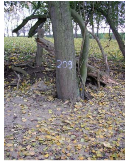
Einzelbaum-Monitoring an 60 Bäumen, die von einer Übererdung des Stammfußes bzw. der Kronentraufe betroffen sind; sowie an 50 Kontrollbäumen auf den Böschungsoberkanten