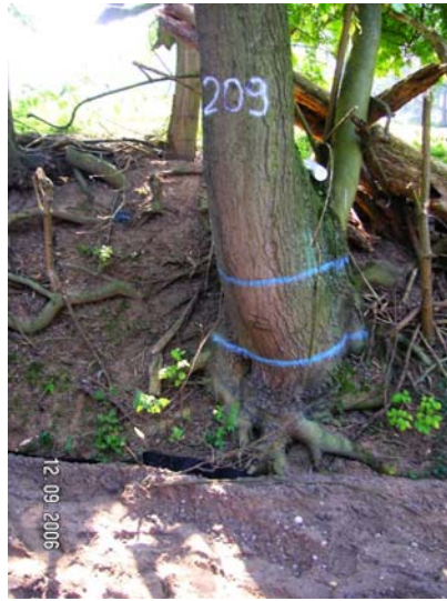
Beweissicherungsdokumentation über den Verlauf der Baumaßnahme, Ereignis-Protokolle für Einzelbäume